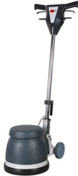
Die Abbildung repräsentieren nicht das Modell

VIPER VE 13 P ist eine kleine Low-Speed Einscheibenmaschine, die für geringere Reinigungsanforderungen konzipiert ist. Durch das Plattformdesign können wir die VE Maschinen zu einem attraktiven Preis-Leistungs-Verhältnis anbieten. Sie sind einfach und leicht zu bedienen.